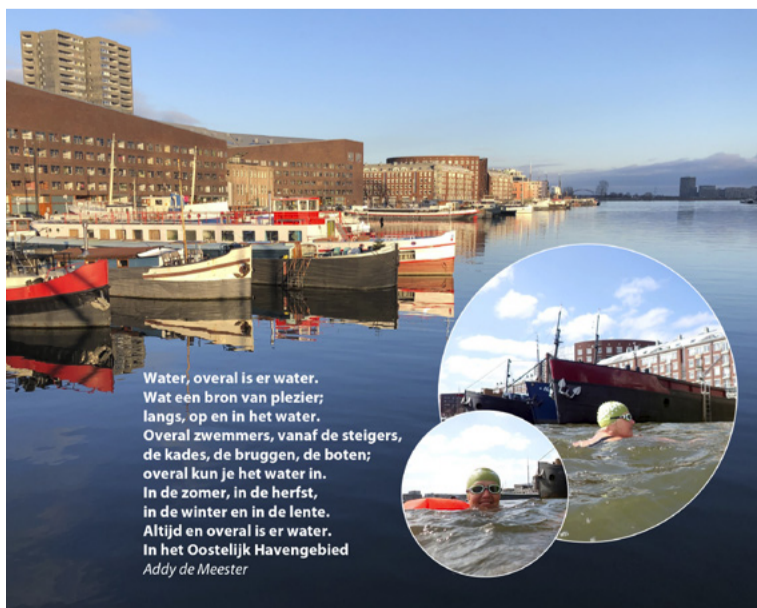
Water, overal is er water. Wat een bron van plezier; langs, op en in het water. Overal zwemmers, vanaf de steigers, de kades, de bruggen, de boten; overal kun je het water in. In de zomer, in de herfst, in de winter en in de lente. Altijd en overal is er water. In het Oostelijk Havengebied Addy de Meester

Oplage: 150 exemplaren. Drukwerk: Drukkerij Impressed Print & Sign, Pijnacker Vormgeving: van Rosmalen & Schenk Redactie: Ditte Veerman, Gerda van Rossum, Richard Vrieling Met medewerking van o.a. Hetty Vlug, Herman Bouwmeester, Aad Verkleij, Meta de Vries