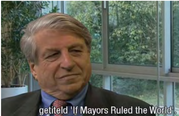
getiteld 'If Mayors Ruled the World'.

overheid. Zo laat Bloomberg zich op het terrein van veiligheid en politie-inzet niets gelegen liggen aan Washington en is hij in de strijd tegen obesitas een vendetta begonnen tegen grote bекers Cola en andere suikerhoudende frisdranken. Onlangs joeg hij de Newyorkse horeca in de gordijnen door een verbod aan te kondigen van alle plastic materialen waar dranken en maaltijden in verpakt worden, omdat de stad de deze enorme berg vervuiling simpelweg niet meer kan verwerken. Barber ziet dit type plaatselijke leiders overal opkomen. Hij ziet in de toekomst zelfs een wereldparlement van burgemeesters ontstaan.